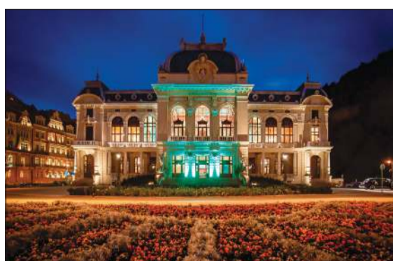
مبنى كايبرباد التاريخي في كارلوفي فاري بجمهورية التشيك حيث أقيم الاحتفال