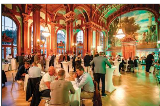
جانب من الحفل السنوي

وتعد جائزة «وكيل العام» من أهم الجوائز التي تمنحها شكودا العالمية، لتكريم الوكلاء المتميزين الذين يتفوقون في الأداء البيعي، ورضا العملاء، وخدمة ما بعد البيع، وتطوير العلامة التجارية. كما يمثل هذا الإنجاز محطة فارقة في مسيرة شركة بهبهاني للسيارات، الاسم الرائد في قطاع السيارات الكويتي، والذي يجسد تاريخاً من التفاني والابتكار والتميز الذي يمتد لعقود. وقد أسهم تركيز الشركة على استراتيجيات متمحور حول العملاء، وتجارب بيع بالتحزئة مبتكرة، واستثمارات مستمرة في أحدث التقنيات، في ترسيخ حضور علامة شكودا المتنامي في الكويت.