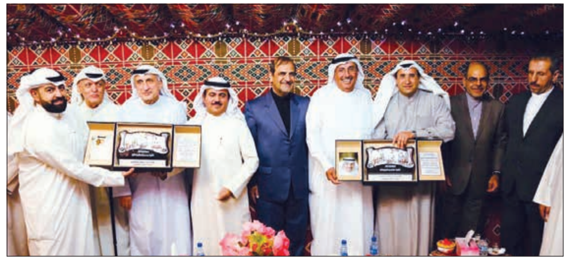
جانب من التكريم في ديوان بوشهري

السمو الأمير الشيخ صباح الأحمد في جعل الكويت مركزاً متميزاً للتكنولوجيا والاقتصاد الرقمي. وأضاف د. البقاعين أن القمة ستعقد على مدى يومين