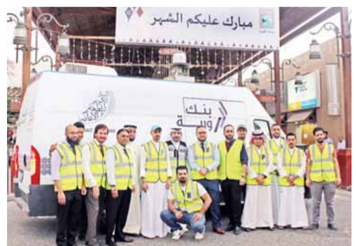
جانب من حملة إفطار الصائم

ونشاطات وفعاليات للموظفين وعكادته في كل سنة، نظم بنك وربة مسابقة لحفظ القرآن الكريم لأبناء الموظفين، تم تقسيمها الى فئتين: الفئة الأولى تضم متسابقين من عمر 6 إلى عشر سنوات، والفئة الثانية من عمر 11 إلى 14 سنة، حيث تم اختيار عشرة فائزين من كل فئة، وحصلوا على جوائز نوعية تشجيعاً لهم على دأبهم لحفظ السور القرآنية المباركة.