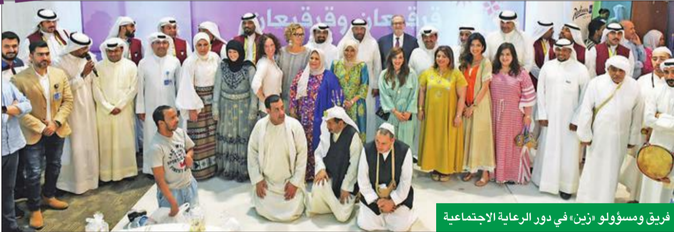
فريق ومسؤولو «زين» في دور الرعاية الاجتماعية

اختتمت شركة زين حملتها الرمضانية السنوية «زين الشهور»، والتي استقبلت الشركة من خلالها شهر رمضان المبارك هذا العام بمجموعة كبيرة من المساهمات الخيرية والإنسانية والاجتماعية والدينية والرياضية والترويحية على مدار الشهر الفضيل تزينت بالتعاليم الإسلامية السمحة والقيم الكوينة الأصيلة.