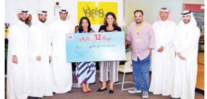
صورة جماعية تعيد إعلان الفائز بالجائزة

كما يوفر عرض حساب الراتب لعام 2019 لجميع العملاء الكويتيين الجدد، ممن يقومون بتحويل رواتبهم إلى بنك الخليج، فرصة الدخول تلقائياً في السجوبات الشهرية والفوز بـ 12 ضعف الراتب، وفي السحب السنوي على أكبر جائزة لحساب الراتب في الكويت، وهي 100 ضعف الراتب.