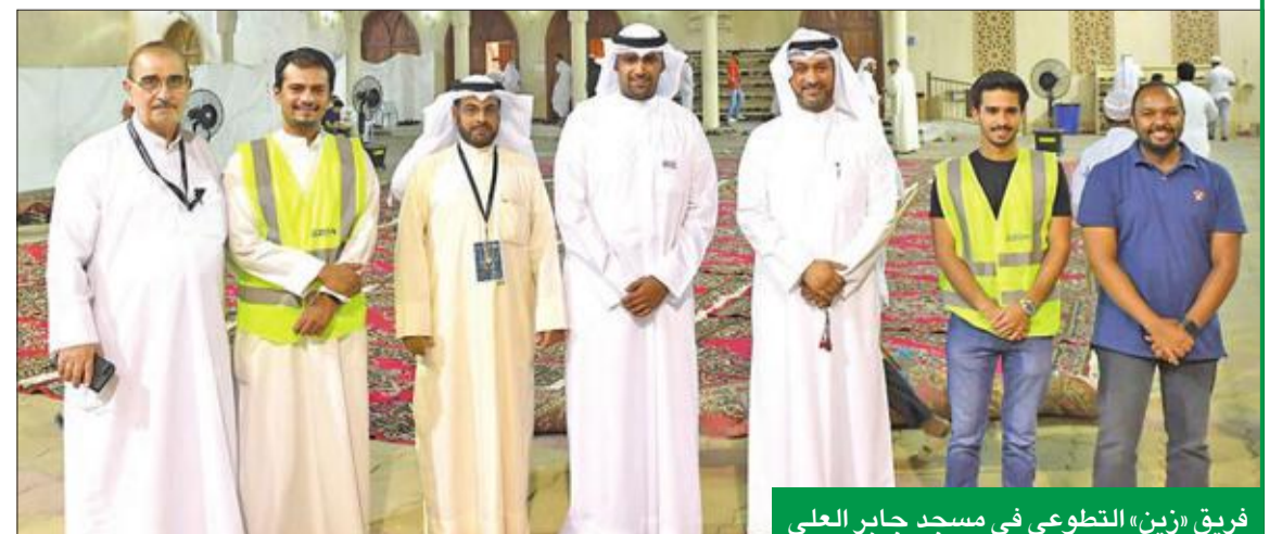
فريق «زين» التطوعي في مسجد جابر العلي