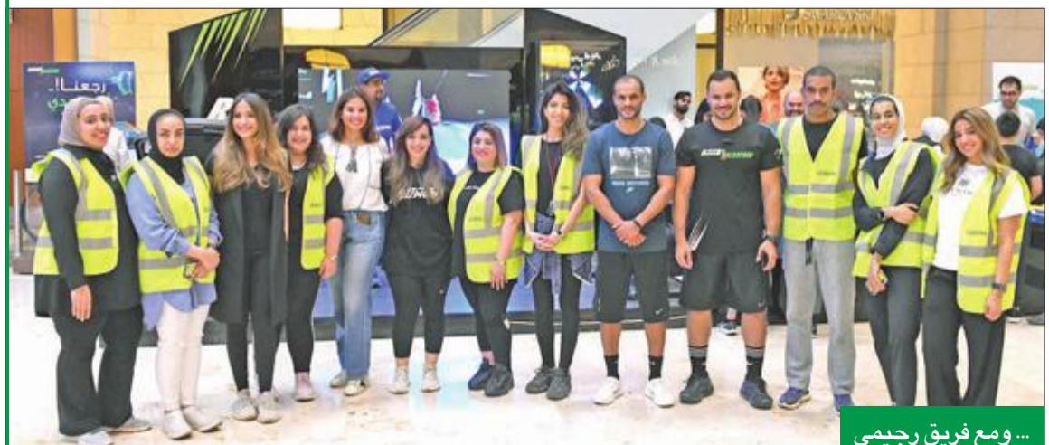
... ومع فريق رجيمي

حرصت زين في شهر رمضان المبارك على تنوع محتوى حملتها ليشمل البرامج والفقرات الثقافية والترويحية، حيث قامت زين برعاية برنامج «جبر خاطر» الذي يقدمه الناشط في وسائل التواصل الاجتماعي فهد البشارة، والذي عرض على وسائل التواصل، وتناول فيه البشارة العديد من المواضيع حول مكارم الأخلاق، وصلوة الأرحام، وقيم الشهر الفضيل، وذلك بطريقة حديثة وسهلة تتميز بكونها قريبة من قلوب المشاهدين وخاصة الشباب منهم.